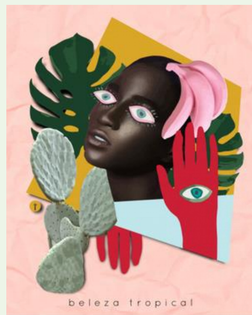
(ARTE: MARCELA DE BETTIO)