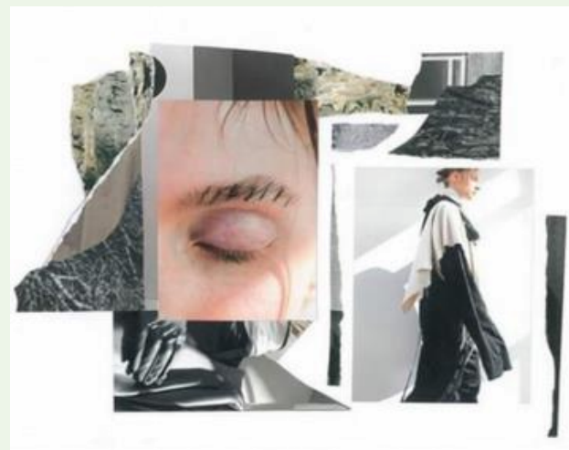
COLINHO, DE LUIZA DE ALEXANDRE

COM ESSA VIVÊNCIA VOCÊ VAI COMPOR DUAS IMAGENS UMA QUE REPRESENTE O SEU SENTIMENTO EM RELAÇÃO AO FAZER PEDAGÓGICO NO PRIMEIRO SEMESTRE, E OUTRA QUE REPRESENTE O QUE VOCÊ QUER SENTIR NO SEGUNDO SEMESTRE, SE EXPRESSANDO COM ARTE.