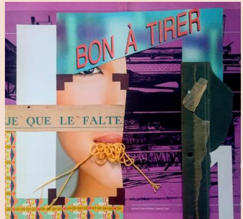
COLAGEM "DESJEJUM", DO LIVRO 'NA MINHA CASA HÁ UM LEÃO' (ARTE: TATIANA CRUZ)

A COLAGEM FOI DESENVOLVIDA POR BRAQUE E PICASSO EM TORNO DE 1911, NO FINAL DA PRIMEIRA FASE DO CUBISMO, ELA É JUSTAMENTE CONSIDERADA COMO UM DOS ACHADOS MAIS RELEVANTES DA ARTE MODERNA E COMO UM ELEMENTO CENTRAL DO CUBISMO. NESSA CONDIÇÃO, A COLAGEM É OBJETO DE INTERPRETAÇÕES VARIADAS.